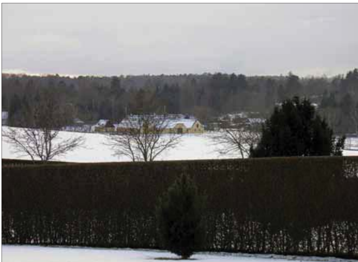
Udsigten fra Erik Lund-Hansens grunde, mod Tibirke Lunde.