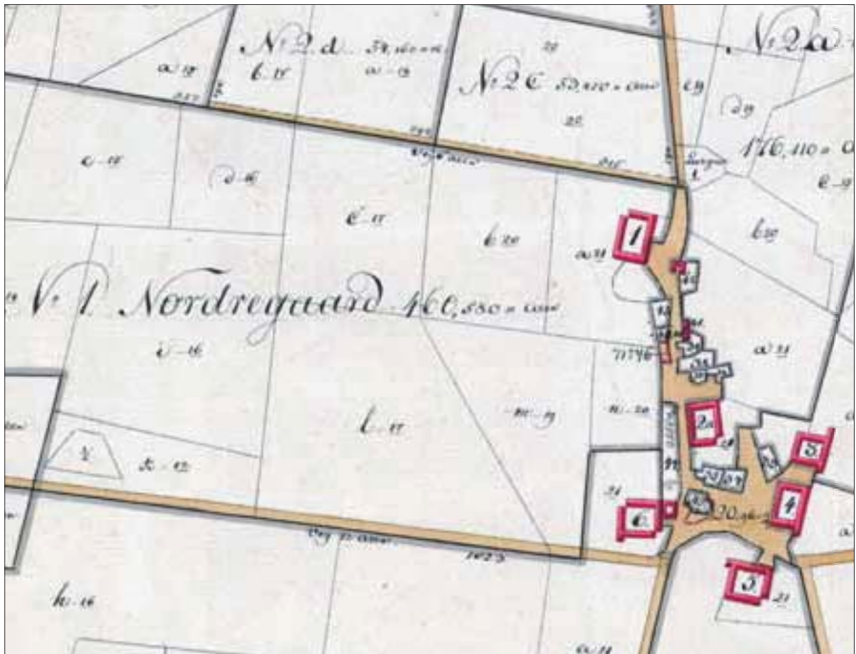
Udsnit af matrikelkort, Holløse 1861 – 1873

Vejene har navn efter den frugtavl, som blev drevet fra Nordregården den seneste snes år før udstykningen – Hasselvænget, Kirsebærvænget, Valnøddevænget, Grev Moltke Vænget,