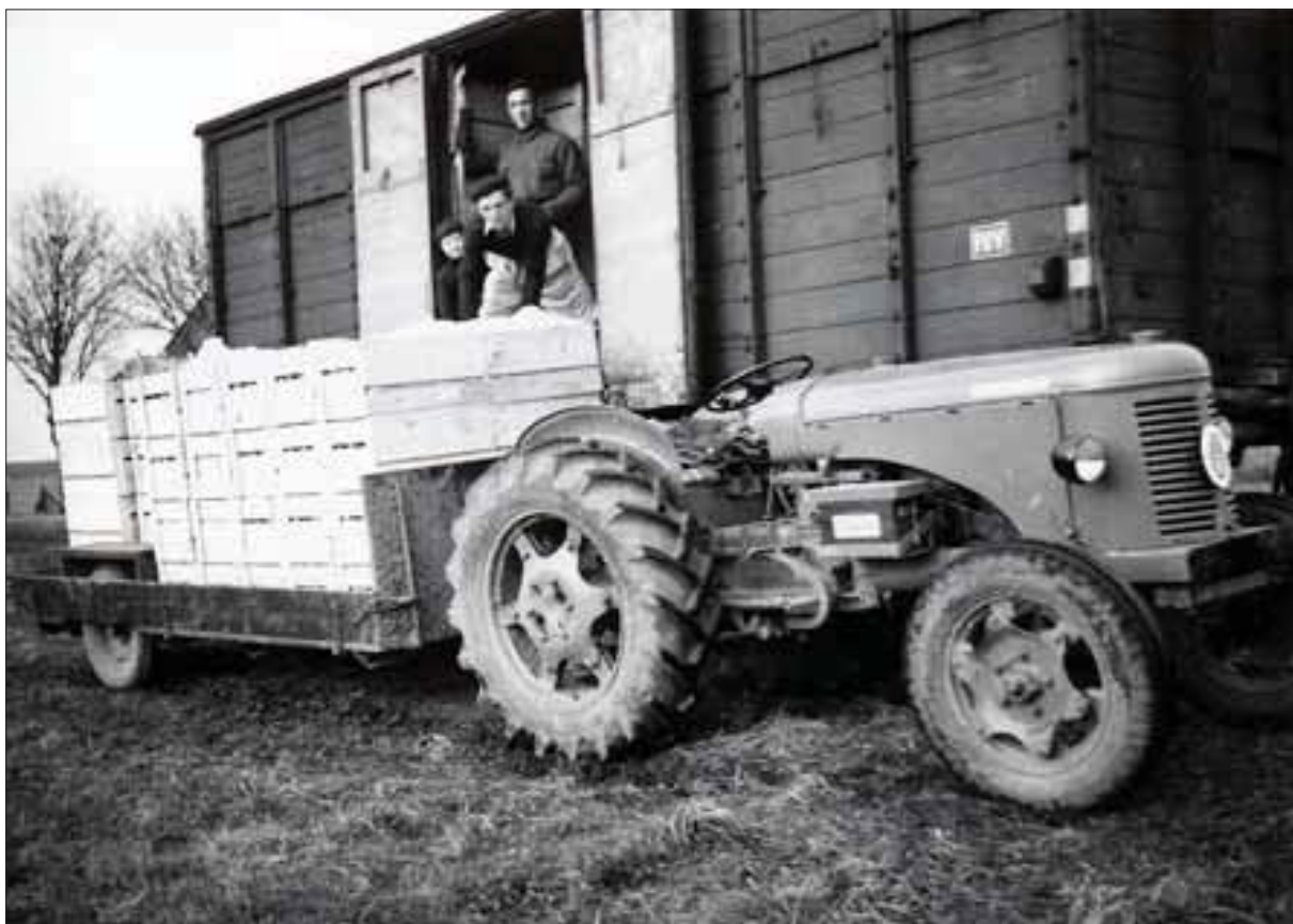
Frugten lastes i en jernbanevogn på sidesporet ved Holløse Trinbræt.