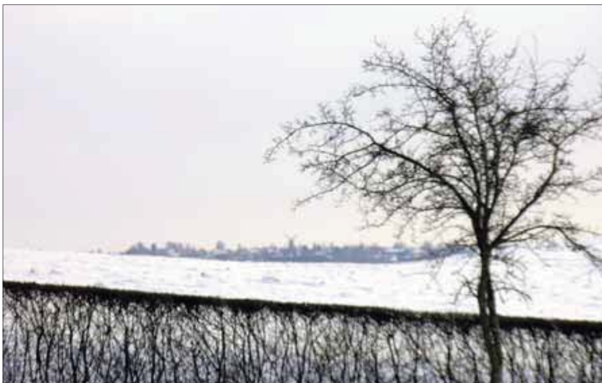
Udsigten fra Erik Lund-Hansens grunde, mod Ramløse Mølle.