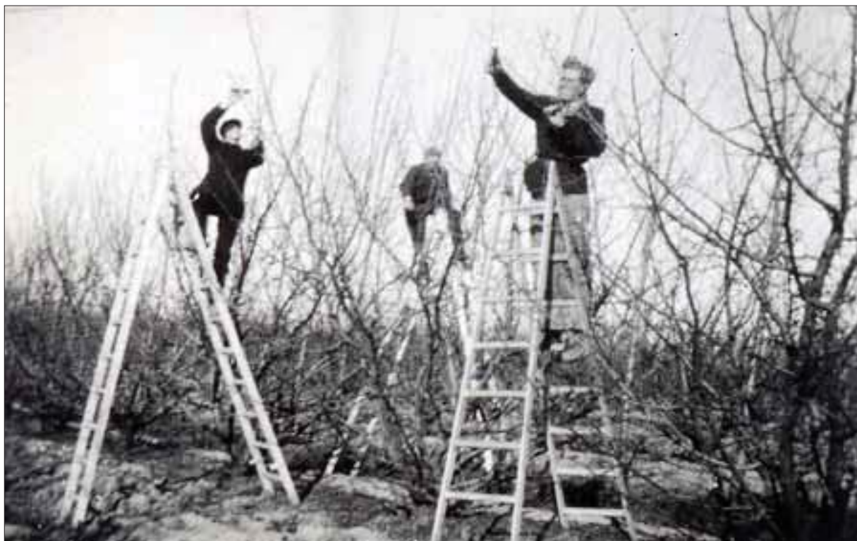
Beskæring i vinterfrost