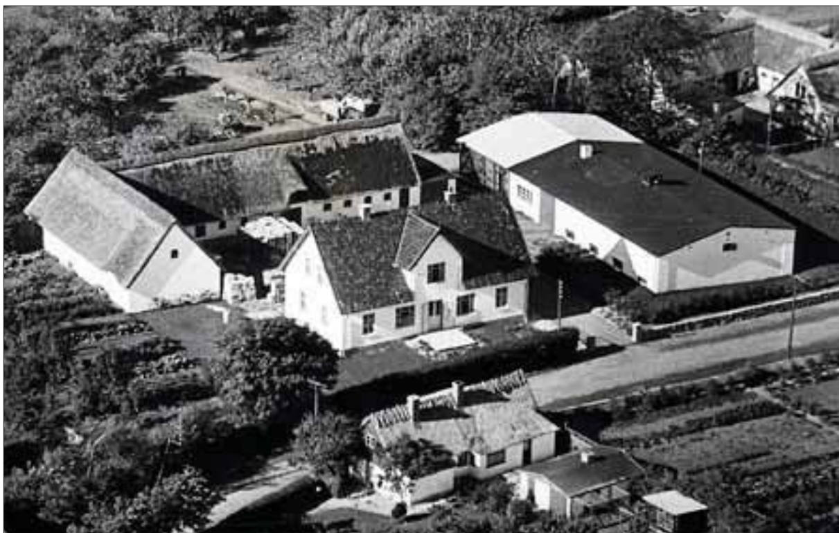
Luffoto af Nordregård, Holløse By. Foto: Sylvest Jensen i 1950'erne

Blommevænget og Æblevænget – og vejen Frugthaven som er eneste adgangsvej.