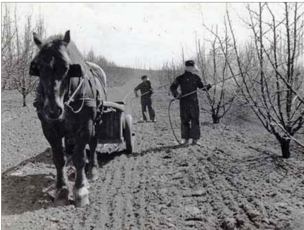
Sprøjtning af frugttræerne

Året rundt begyndte arbejdet kl. 7. Til morgenmad fik de en kop the og et stykke brød. Klokkeren 8.30-9.00 serverede Karen havregrød eller øllebrød, og klokken 12 fik de to retter, først kærnemælkssuppe eller bygvandgrød og så varm mad med kartofler. Om aftenen var der smørrebrød, og de kunne også spise æbler fra plantagen. Karen tilberedte således fire måltider om dagen, og hun havde i alt 22 retter på menuen.