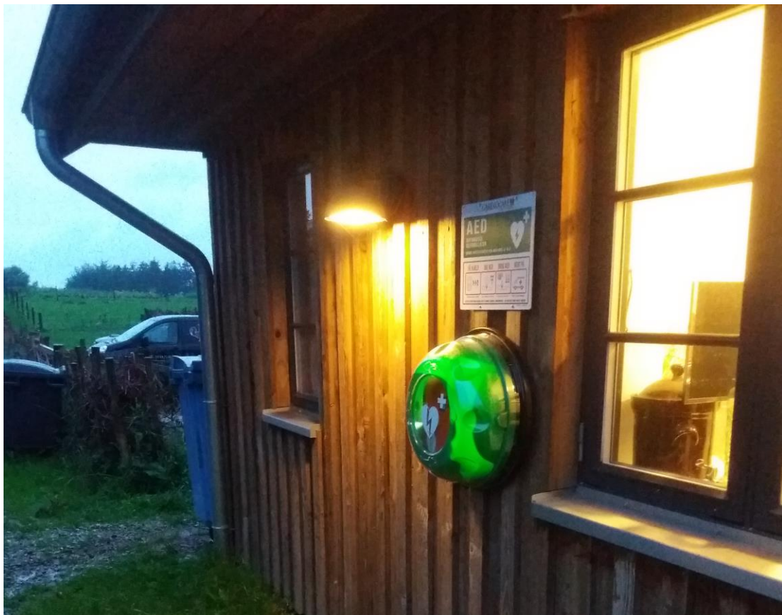
Hjertestarter opsat på Rabarbergården 2018

I det forløbne år har vi haft fornøjelsen at byde velkommen til følgende nye grundejere: